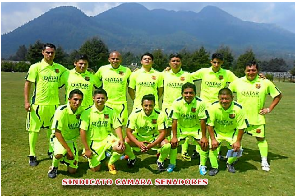
SINDICATO CAMARA SENADORES