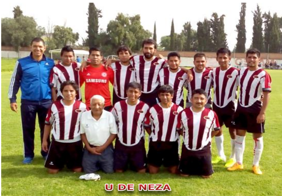
U DE NEZA

Todos los Equipos deben de Reportar el Marcador de su Partido, los domingos de 14:00 a 17:00 horas a los teléfonos 55118003 y 46332175 o al correo: gerencia@ligaes.com