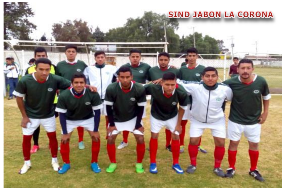
SIND JABON LA CORONA