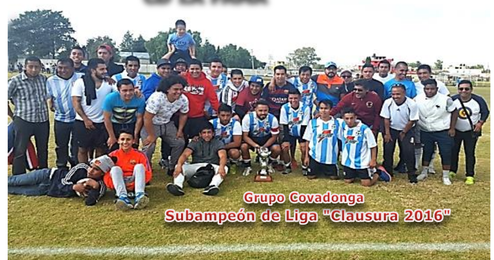
Grupo Covadonga Subampeón de Liga "Clausura 2016"