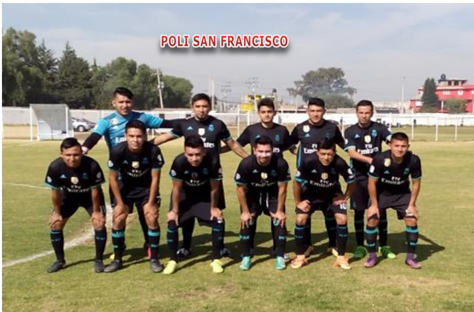
POLI SAN FRANCISCO