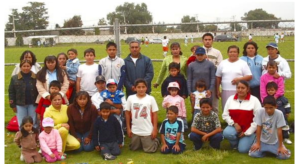
Acompañantes del equipo Estrellas Atempa

Los tiempos de los partidos son de 45 minutos, siempre y cuando el partido inicie a la hora de estar programado o dentro del tiempo de tolerancia. Pudiera no haber descanso.