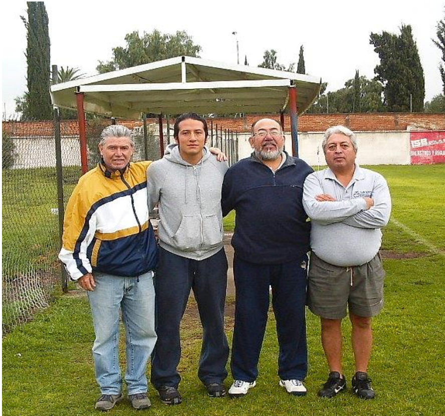
Cuerpo Técnico del equipo CF Estudiantes