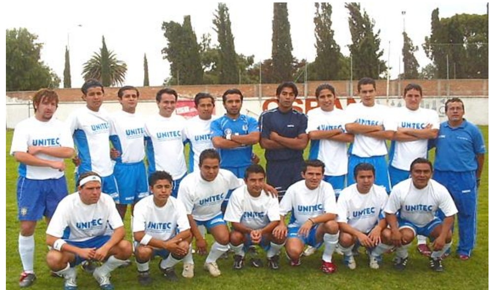
UNITEC SUR 2006