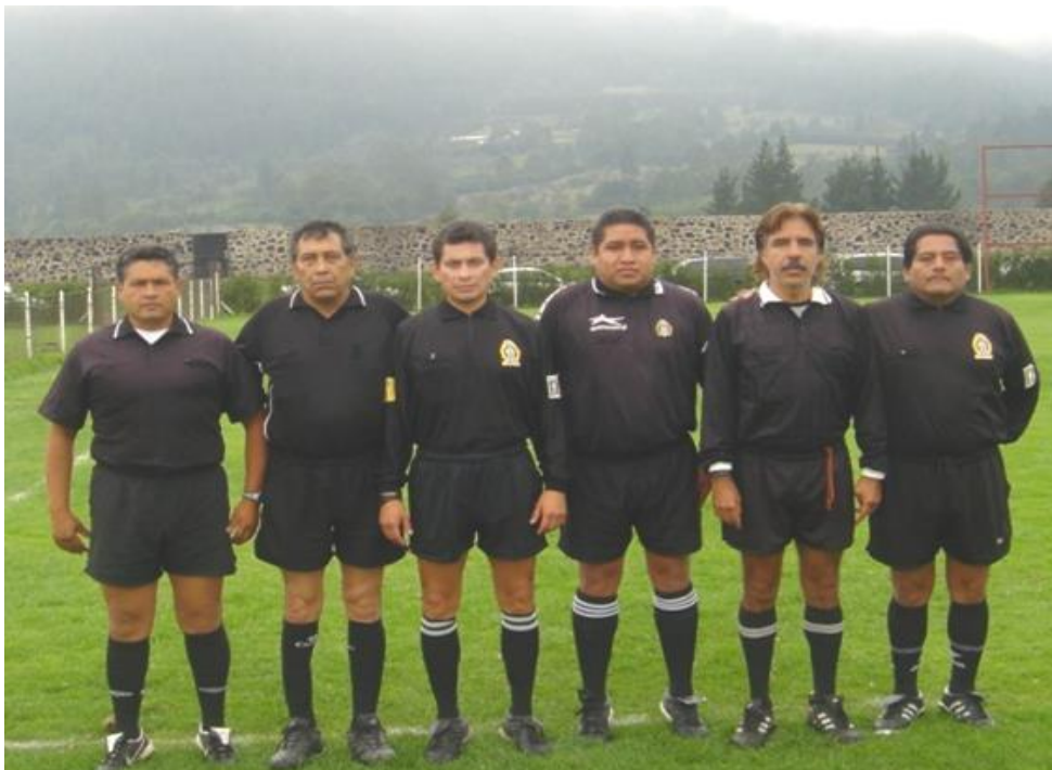
Arbitros en Ajusco el 30 de Julio de 2006

Las sanciones aplicadas a los Equipos deben de estar cubiertas en el transcurso de la semana. De esta forma serán tomados en cuenta para la aplicación del 1/2 punto. No se aplicarán en forma retroactiva.