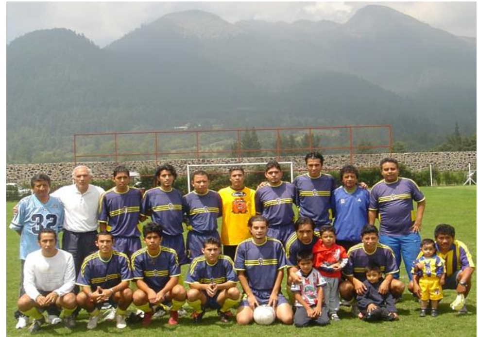
DEPORTIVO GUADALUPE 2006

Correo Electrónico: liga@ligaespanolafutbol.com