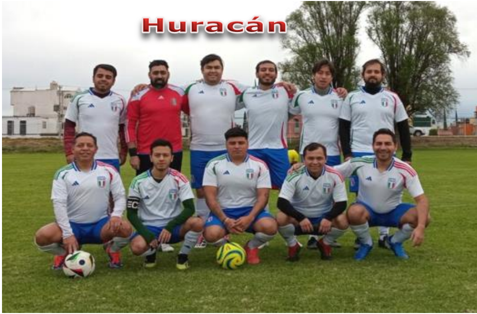
Obligación de presentar 2 Balones en condiciones reglamentarias