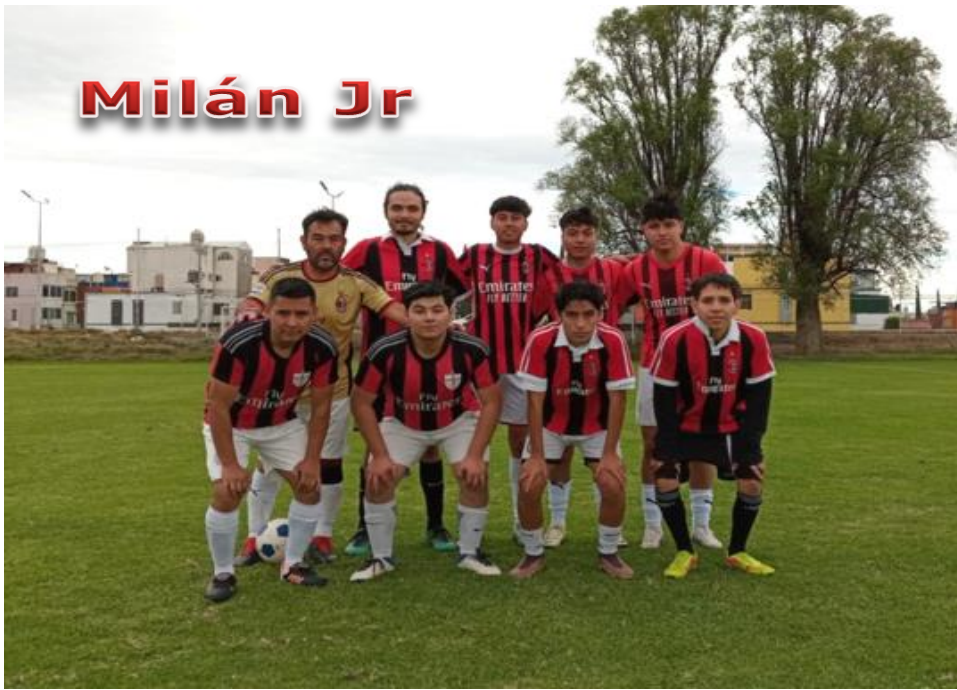
Obligación de presentar la Hoja de Alineación actualizada