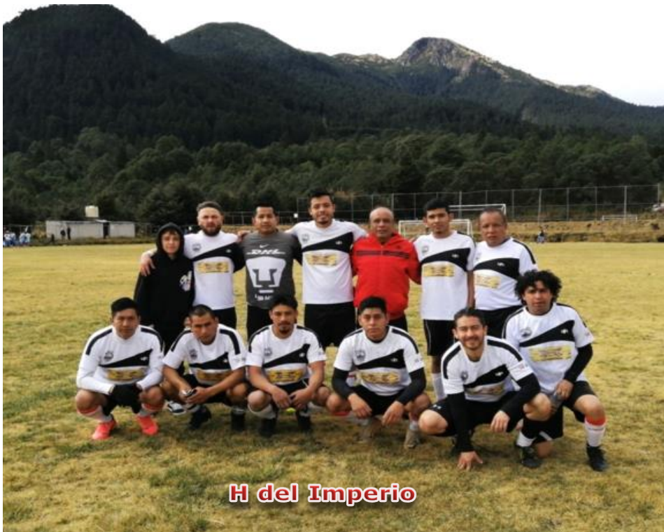
H del Imperio