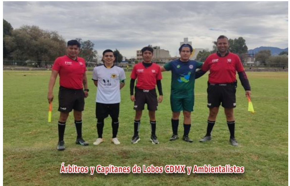
Árbitros y Capitanes de Lobos CDMX y Ambientalistas

Para que los Equipos puedan solicitar un Default, el equipo debe de estar uniformado, dentro de la cancha y haber entregado Hoja de Alineación y Registros durante la Tolerancia.