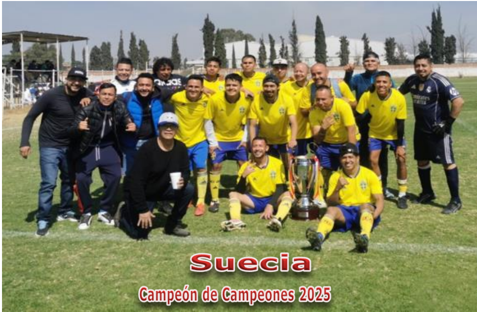
Suecia Campeón de Campeones 2025

Obligación de presentar 2 Balones en condiciones reglamentarias