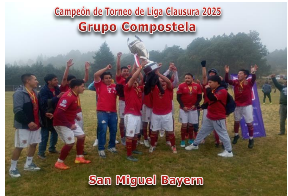
San Miguel Bayern

Para que los Equipos puedan solicitar un Default, el equipo debe de estar uniformado, dentro de la cancha y haber entregado Hoja de Alineación y Registros durante la Tolerancia.