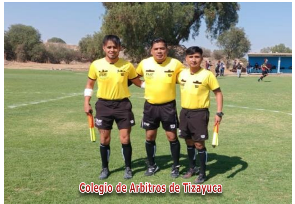
Colegio de Arbitros de Tizayuca

Obligación de presentar 2 Balones en condiciones reglamentarias