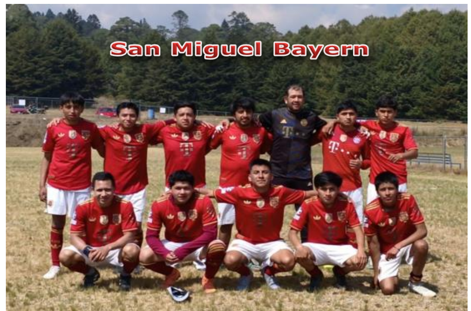
San Miguel Bayern